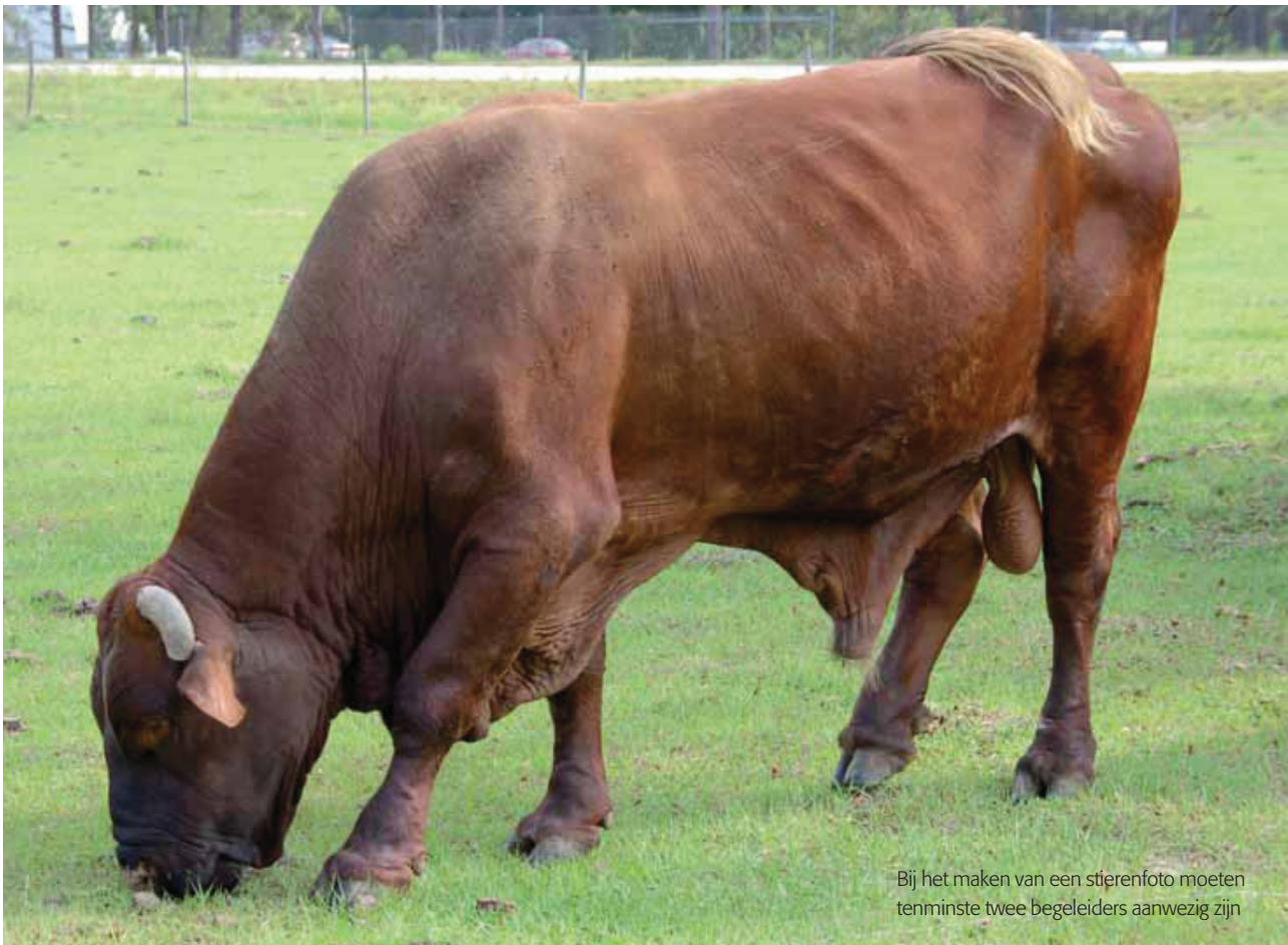
Bij het maken van een stierenfoto moeten tenminste twee begeleiders aanwezig zijn