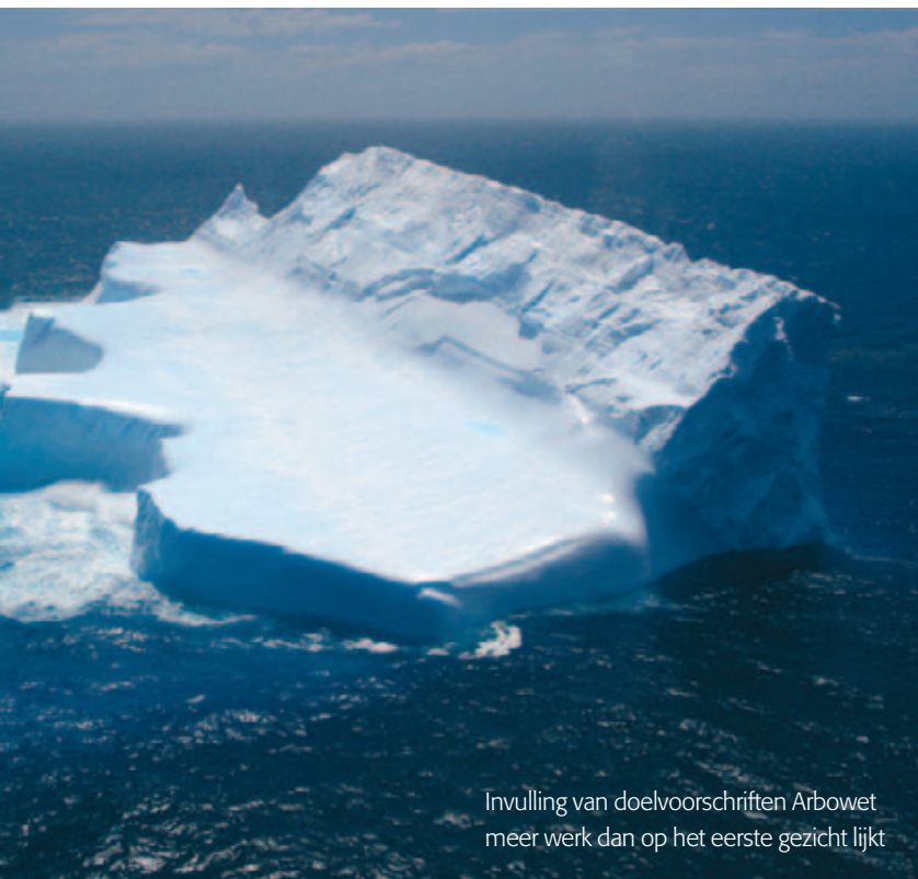
Invulling van doelvoorschriften Arboret meer werk dan op het eerste gezicht lijkt