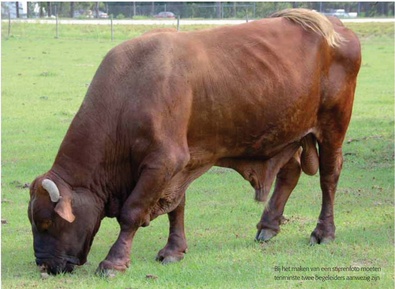
Bij het maken van een stierenfoto moeten tenminste twee begeleiders aanwezig zijn